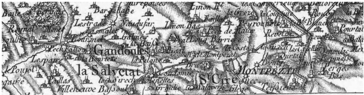
5. Le château de Lesparre et le lieu de Lestrad sur la carte de Cassini (BNF, 1762).

À compter du XVI e siècle, les Beaufort passent dans l'obscurité. L'on ne sait ce qu'ils firent durant les Guerres de religion. L'époux d'une Catherine de Beaufort, Jean de Boisset, fut un seigneur protestant 55 .